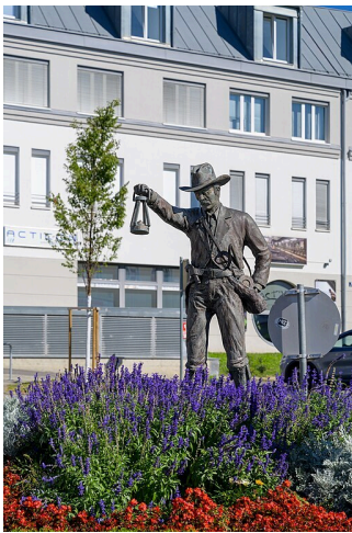
Réva vinná