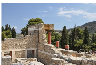
Severní vstup do Knossu