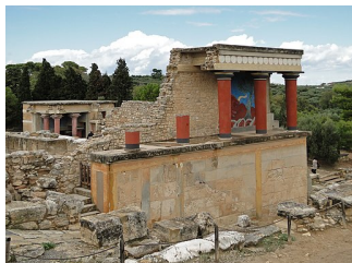
Knossos - severní portikus