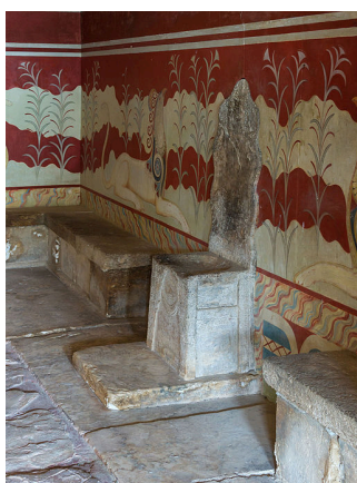
Trůn Mínoa v paláci Knossos