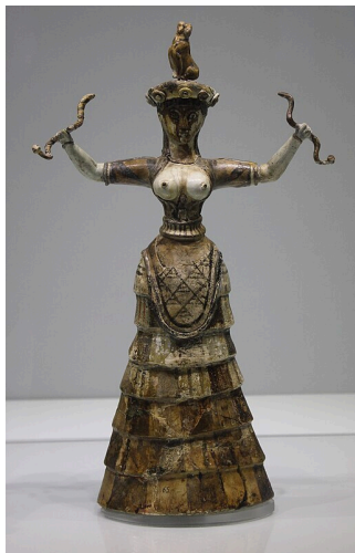
Hadí bohyně