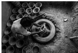
Hra s hrnčířským kruhem