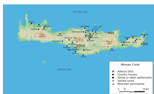
Mapa mínojské Kréty