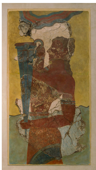
The "cup bearer" fresco Knossos Heraklion museum Crete Greece