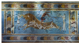
Skok přes býka

📄 Starověká Kréta - pověst o Minotaurovi: https://www.zsbystrice.cz/images/Kr%C3%A9ta_-_M%C3%ADnojsk%C3%A1_civilizace.pdf