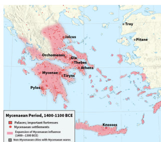
Mykénský svět

☐ Proč padla Mýnojská civilizace?: https://www.memento-historia.cz/clanek/318/minojaska-kreta-proc-padla-nejvyspelejsi-civilizace-sveta