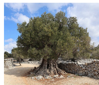
1600 let starý olivovník v Lunu