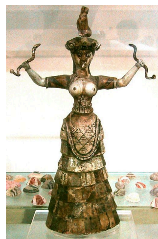
Hadí bohyně