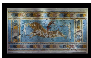
Bull leaping minoan fresco archmus Heraklion