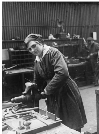
Stavba lodí během první světové války