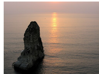
Západ slunce nad Středozemním mořem, Holubí skály, Bejrút, Libanon

☐ Význam Kréty v dějinách Evropy: https://edu.ceskatelevize.cz/video/4119-staroveka-kreta