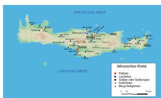
Mapa mýnojské Kréty