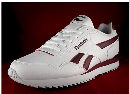
Boty Reebok Royal Glide Ripple Clip