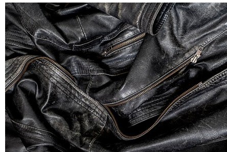
Černá kožená bunda