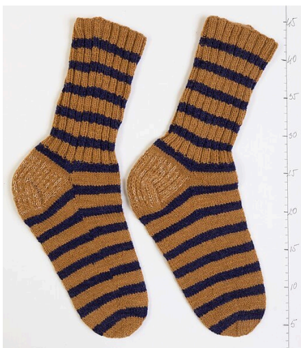
Vlněné ponožky