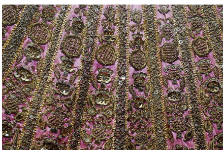
Růžová sukně s výšivkou